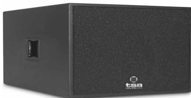
Imagen / Image

The SUB-218F is compact and is designed to eliminate unwanted energy behind the enclosure providing the greatest accuracy in low frequency reproduction without the need of excessive EQ.