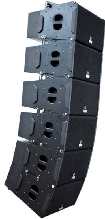
Imagen / Image

The vertical splay angles between units is 10°. It has an integrated double rigging mechanism for easy and quick deployment, a mobile element that allows splay angles of 0° to 10°, and another fixed element to configure the splay angles between units. The rigging hardware features the same mechanism.